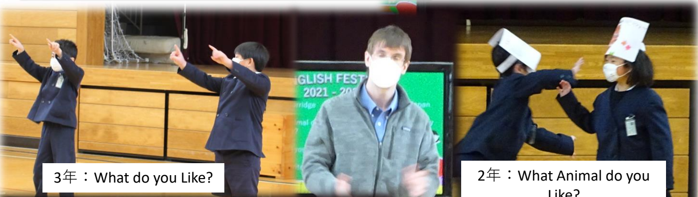
3年：What do you Like?