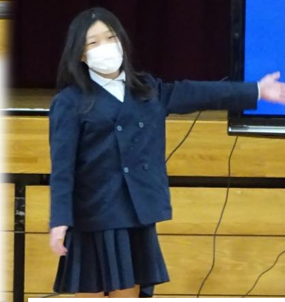
4年：My Favorite Place