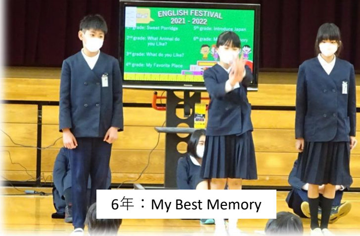
6年：My Best Memory